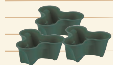
ハーベリーポット 3コ